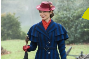
メリー・ポピンズ: Emily Olivia Leah Blunt