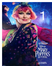
メリーの従姉妹で修理屋の トプシー: Meryl Streep