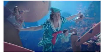
水中遊泳を楽しむメリーと子供たち