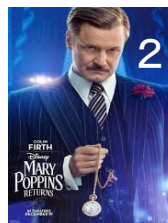
フェデリコ銀行の頭取: Colin Firth 時刻を見ている