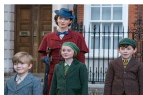
バンクスの3人の子供たち