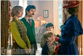
ジェーン（姉）、マイケル（弟）、子供たち、メリー・ポピンズ