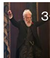
元頭取が現れ銀行の 役割を話す